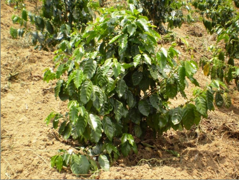
Araabia kohvipuu (arabica)