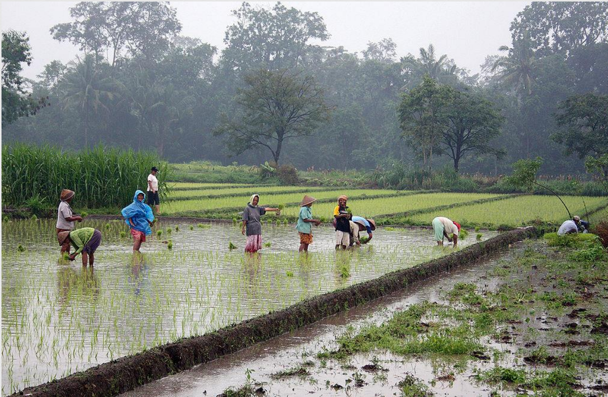
Fotol: riisitaimede istutamine