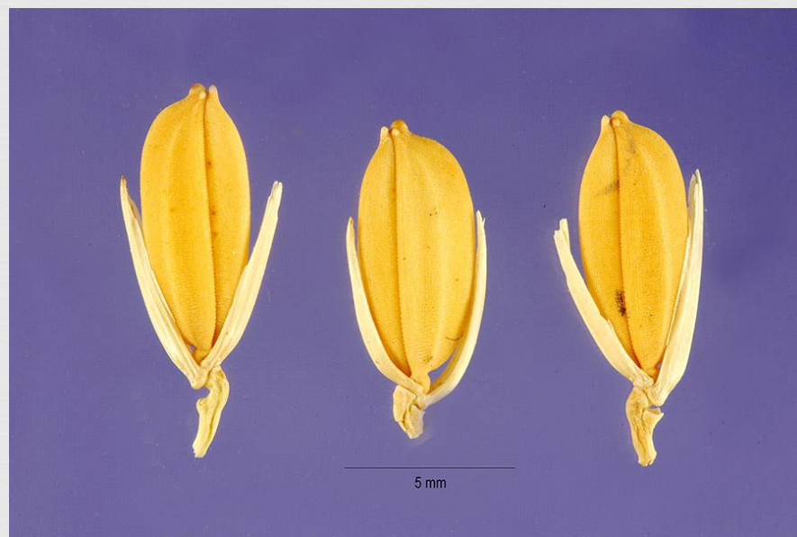
Fotol: Väliskestaga riisiterad